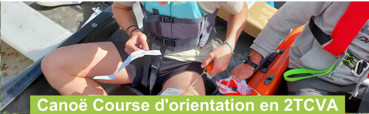
Canoë Course d'orientation en 2TCVA