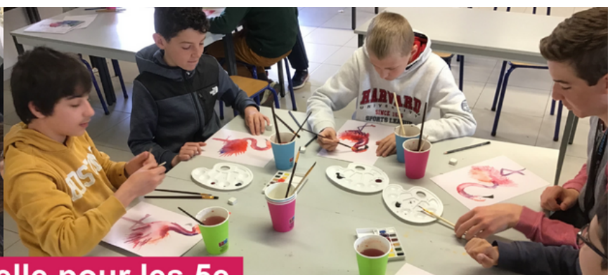
Atelier aquarelle pour les 5e