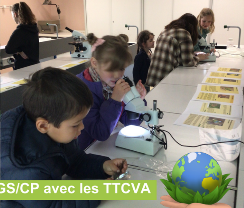
Observation de plumes pour les GS/CP avec les TTCVA