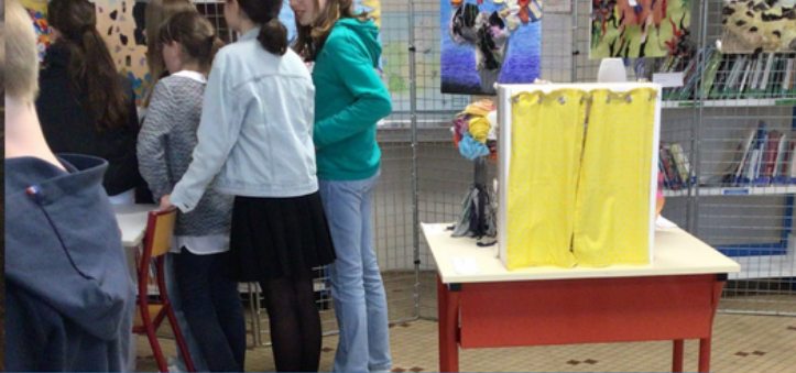
Les Tle option arts plastiques ont expliqué leurs oeuvres aux 6e