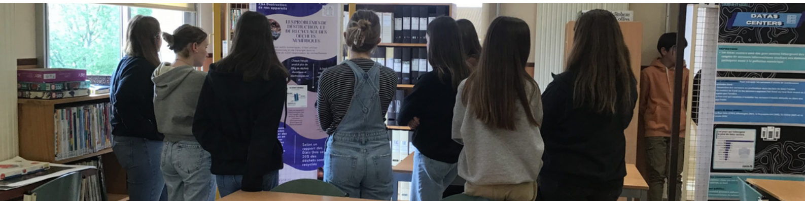
Les 3e ont présenté leur travail sur "la pollution numérique" aux 4e